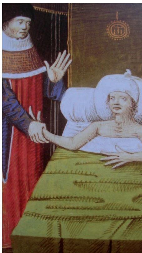
Livre des propriétés des choses, 1480